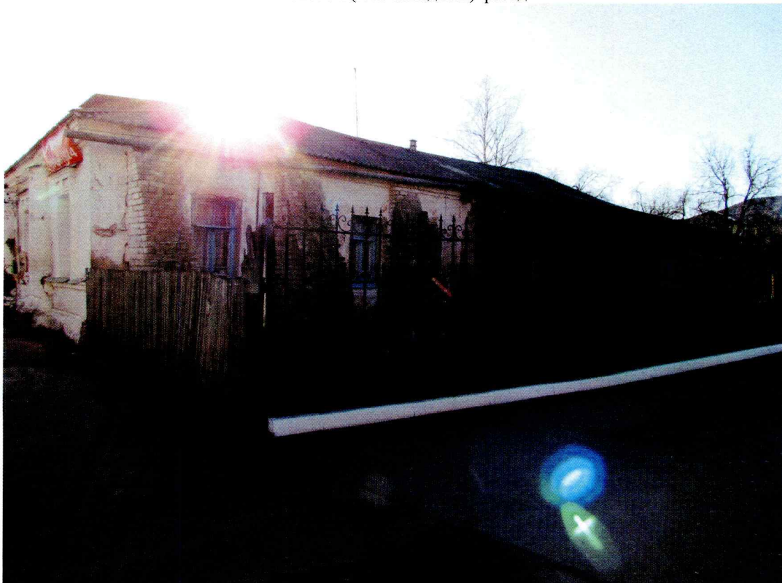
Дом жилой Акатова, 1-я пол. XIX в.» г. Кострома, ул. Комсомольская. 31 Боковой (северо-восточный) фасад