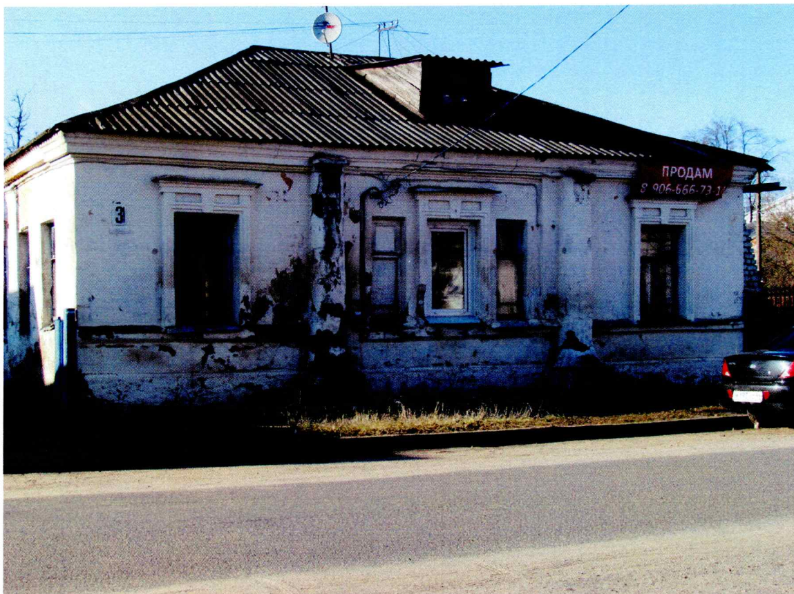
«Дом жилой Акатова, 1-я пол. XIX в.» г. Кострома, ул. Комсомольская. 31 Главный (юго-восточный) фасад

Приложение к охранному обязательству собственника или иного законного владельца объекта культурного наследия, включенного в единый государственный реестр объектов культурного наследия (памятников истории и культуры) народов Российской Федерации