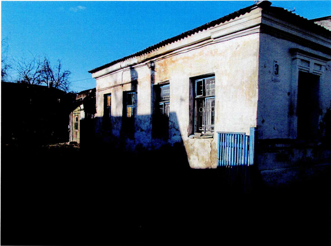
Дом жилой Акатова, 1-я пол. XIX в.» г. Кострома, ул. Комсомольская. 31 Боковой (юго-западный) фасад

Приложение к охранному обязательству собственника или иного законного владельца объекта культурного наследия, включенного в единый государственный реестр объектов культурного наследия (памятников истории и культуры) народов Российской Федерации