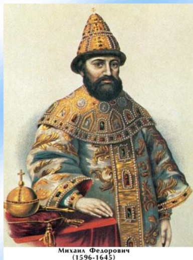
Михаил Федорович (1596-1645)

Восстановление памяти Федоровской иконы Божьей Матери и широкое распространение ее почитания по всей России связано с событиями начала XVII века - прекращением Смутного времени. В 1613 году чудотворной Федоровской иконой из Костромского собора в Ипатьевском монастыре был благословлен при избрании на царство Михаил Романов. Именно это событие ознаменовало начало правления первого царя из династии Романовых, а костромская земля оказалась в центре важнейших событий в истории Российского государства, связанных с утверждением новой царской династии. В мартовские дни 1613 года Кострома стала местом, где представитель этого древнего боярского рода впервые был наречен царем после всенародного избрания на Земском соборе. С восшествием на престол нового государя завершилась многолетняя Смута, и Российское государство наконец обрело возможность для мирного и спокойного развития. Тогда совершил свой подвиг и крестьянин костромской губернии Иван Сусанин. Он завел польский отряд, посланный захватить вновь избранного царя, в непроходимые чащи и там погиб от их рук.