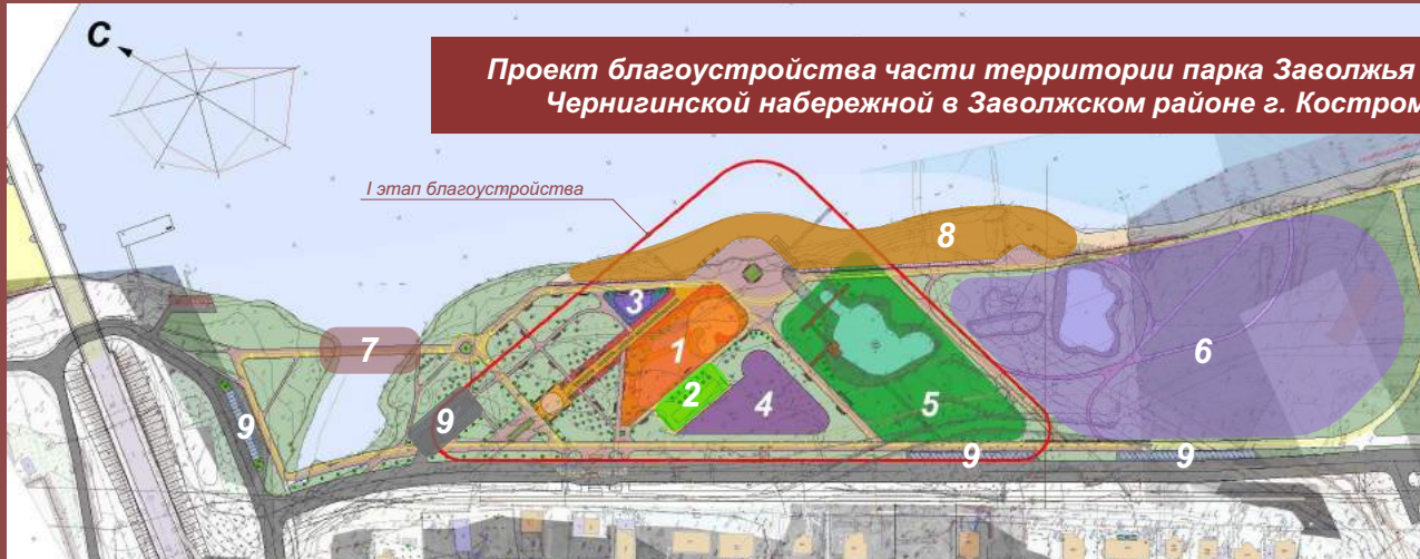
Схема функционального зонирования