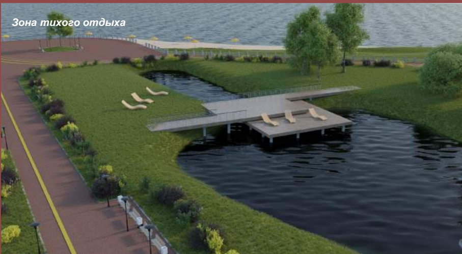
Зона тихого отдыха