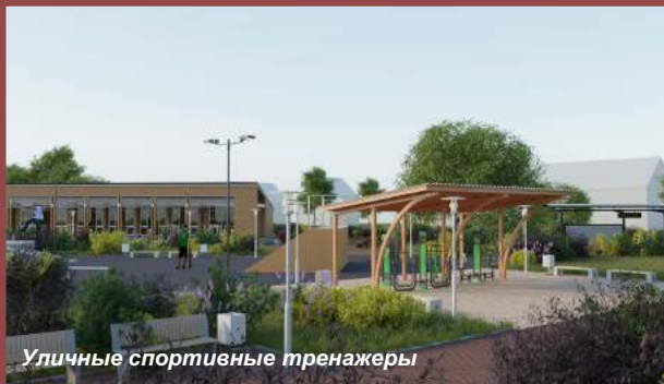
Уличные спортивные тренажеры